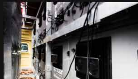
systém ledkových panelů

Plocha statické reklamní plochy celkem (9 m 2 )